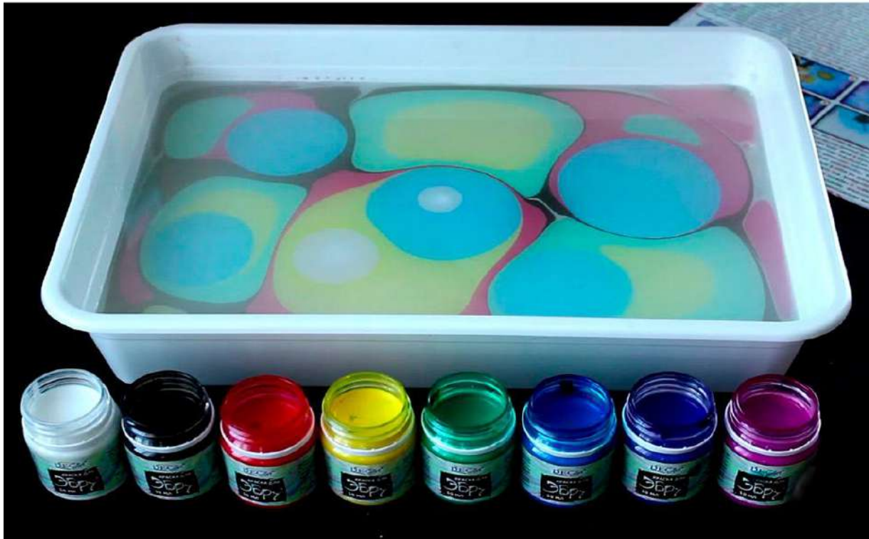
Специальная жидкость для рисования красками ЭБРУ и инструменты

Специальные краски не растворяющиеся в воде