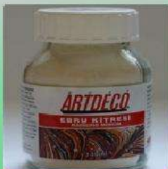
Сухой загуститель для воды